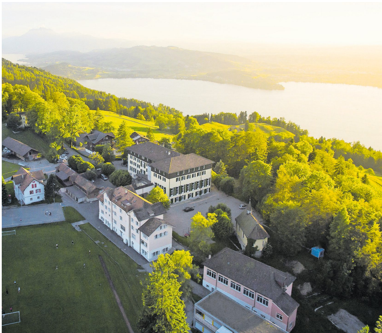
Pädagogische Förderung auch nach Schulschluss: Institut Montana am Zugerberg.

Privatschulen haben den Wunsch von Eltern nach Ganztagesbetreuung der Kinder früh aufgenommen. Da es nun vermehrt auch öffentliche Tagesschulen gibt, verlieren sie ein Verkaufsargument. Sie setzen darum auf besondere Angebote. Von Joëlle Weil